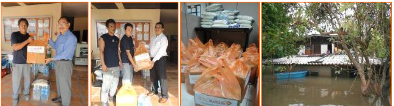
โครงการเพื่อนช่วยเพื่อน "สู้ภัยน้ำท่วม" บริษัทฯ ได้ช่วยเหลือสิ่งของอุปโภคบริโภค เพื่อบรรเทาทุกข์ ให้กับพนักงานที่ประสบภัยน้ำท่วม