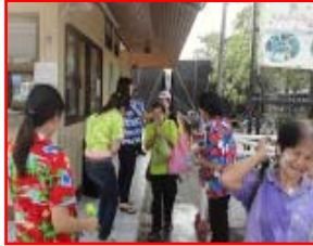
รณรงค์ส่งกรานต์ปลอดภัย