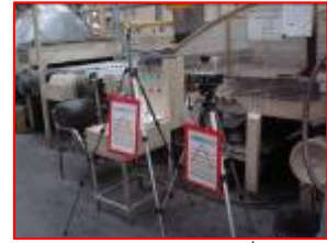
ตรวจวัดคุณภาพอากาศที่ทำงาน

ถือเป็นความรับผิดชอบในการดำเนินธุรกิจที่ต้องรับผิดชอบต่อสิ่งแวดล้อมและทรัพยากรชุมชน จึงให้ความสำคัญกับการควบคุมระบบสิ่งแวดล้อมในกระบวนการผลิต ซึ่งในปีที่ผ่านมาได้ดำเนินการหลายด้านดังนี้