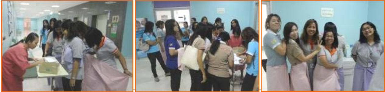
โครงการรณรงค์ตรวจคัดกรองมะเร็งปากมดลูก บริษัทฯ ร่วมกับ โรงพยาบาลเกษมราษฎร์ และสำนักงานหลักประกันสุขภาพแห่งชาติ วันที่ 24 มิถุนายน 2554 เพื่อตรวจคัดกรองและป้องกันมะเร็งปากมดลูกให้กับพนักงานหญิง จำนวน 20 คน