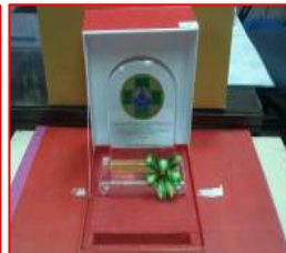
ด้านความปลอดภัย