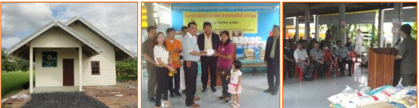
โครงการสร้างบ้านผู้ยากไร้เทิดไท้องค์ราชันย์ บริษัทฯ ร่วมกับ อบต.ดิ่งชัน สร้าง/ซ่อมแซมบ้าน ให้กับผู้ยากไร้ พื้นที่ตำบลดิ่งชัน อำเภอเมือง จังหวัดสระบุรี