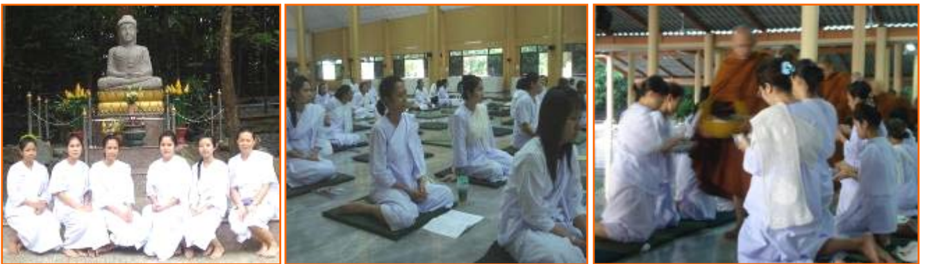
กิจกรรม "การพัฒนาจิตเพื่อชีวิตสมดุลง" ณ สถานปฏิบัติธรรม แสงธรรมส่องชีวิต ตำบลโคกแย้ อำเภอหนองแค จังหวัดสระบุรี วันที่ 7-9 ตุลาคม 2554