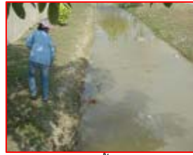
ตรวจคุณภาพน้ำรอบโรงงาน