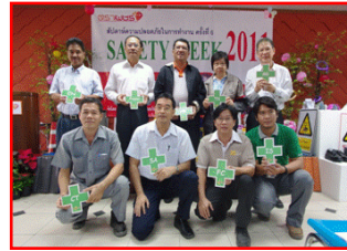
Safety Week 2011