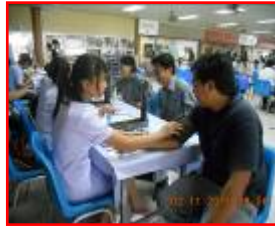
ตรวจสอบสุขภาพประจำปี