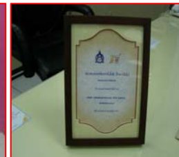
รางวัล 5S Award Model