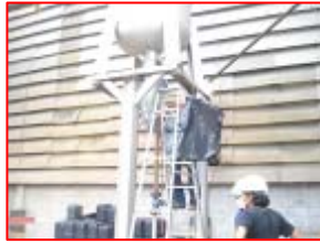
ตรวจวัดคุณภาพปล่อง