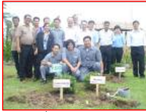
วันสิ่งแวดล้อมโลก