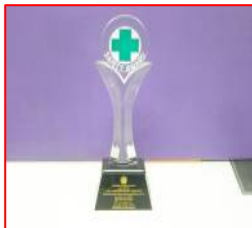
รางวัล Safety Award