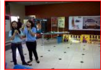
รณรงค์ปีใหม่เมาไม่ขับ

บริษัทฯ ตระหนักถึงความสำคัญด้านความปลอดภัยในการทำงาน และมีความเชื่อว่าอุบัติเหตุ การบาดเจ็บ และโรคที่เกิดขึ้นจากการทำงานเป็นสิ่งที่สามารถป้องกันได้ด้วยความร่วมมือร่วมใจของทุกคนในองค์กร โดยปีที่ผ่านมา บริษัทฯ ได้ดำเนินงานเรื่องความปลอดภัยของพนักงาน ผู้รับเหมา และผู้มาเยือนอย่างต่อเนื่อง