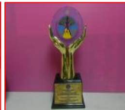
ด้านผลงานสัมฤทธิ์